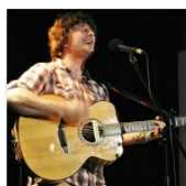
Open Mic POTRVÁ #68 5. 9. 2013