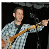
Open Mic POTRVÁ #66 6. 11. 2013