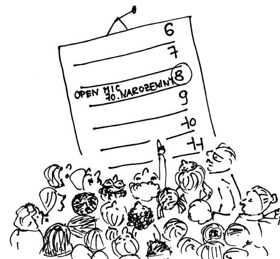
Nezapomeň, mámo! 8. ledna 2014 jdeme do Potrvá! | Kresba: Martina Trchová