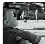
Open Mic na Folimance