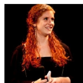
Open Mic POTRVÁ #65 7. 6. 2013