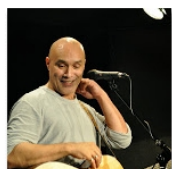
Open Mic POTRVÁ #67 2. 10. 2013